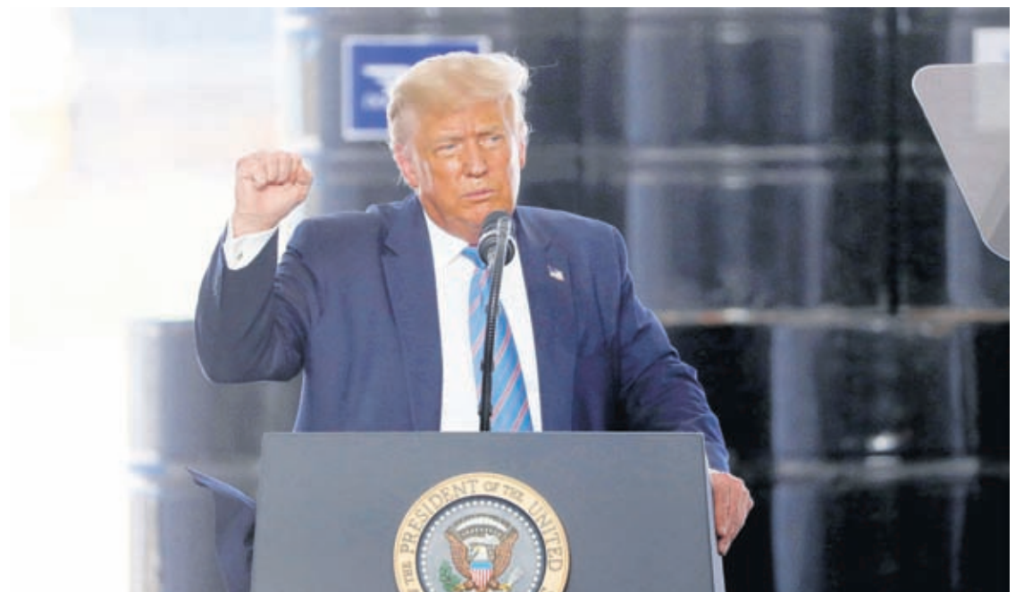
President Donald Trump delivers remarks about American energy production during a visit to the Double Eagle Energy Oil Rig, Wednesday, July 29, 2020, in Midland, Texas.